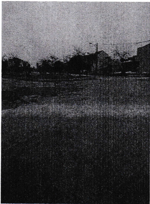
Xịt rửa quét dọn đường