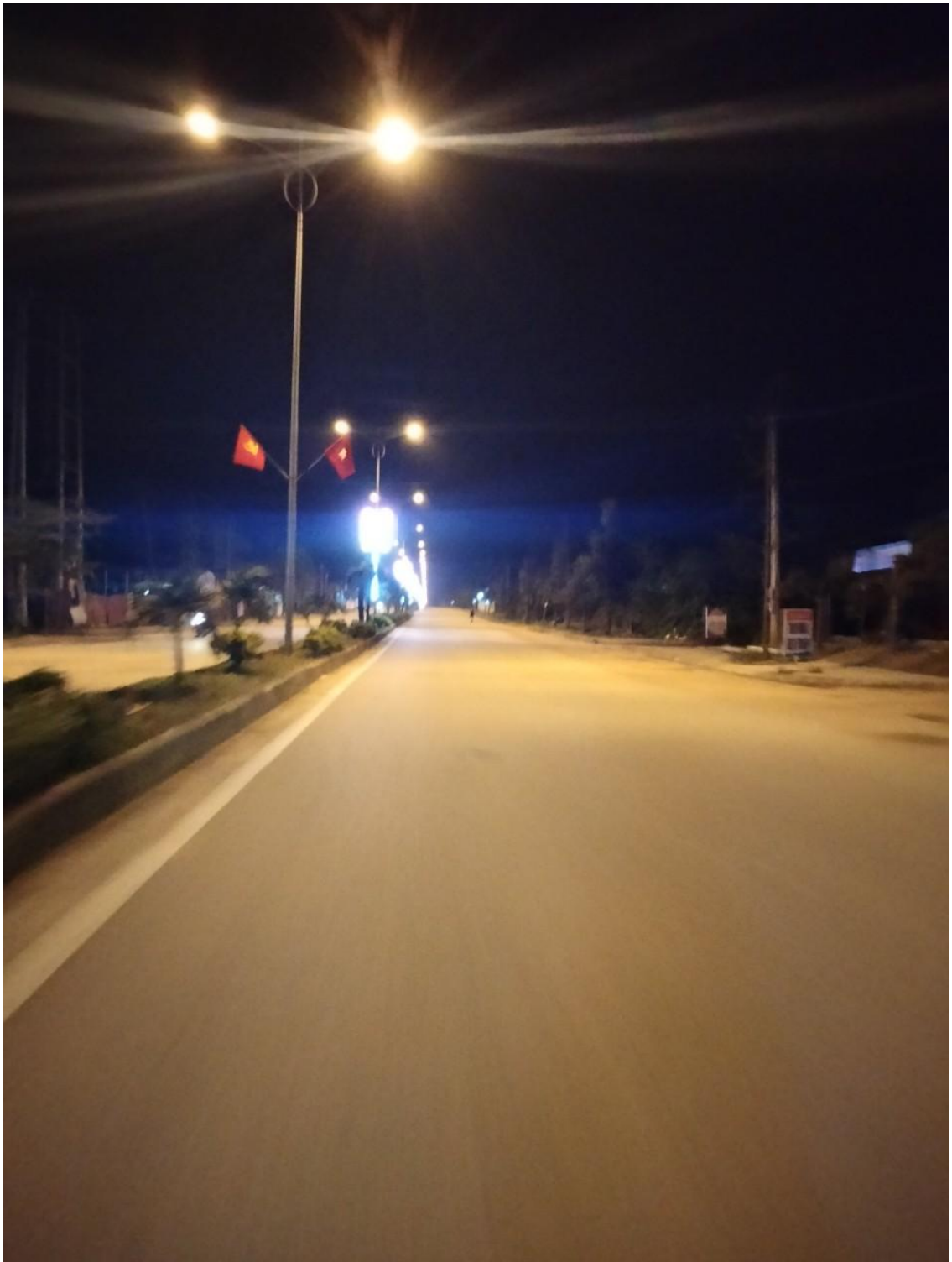
Ảnh 2: Hệ thống điện chiếu sáng công cộng tuyến đường La Sơn – Nam Đông