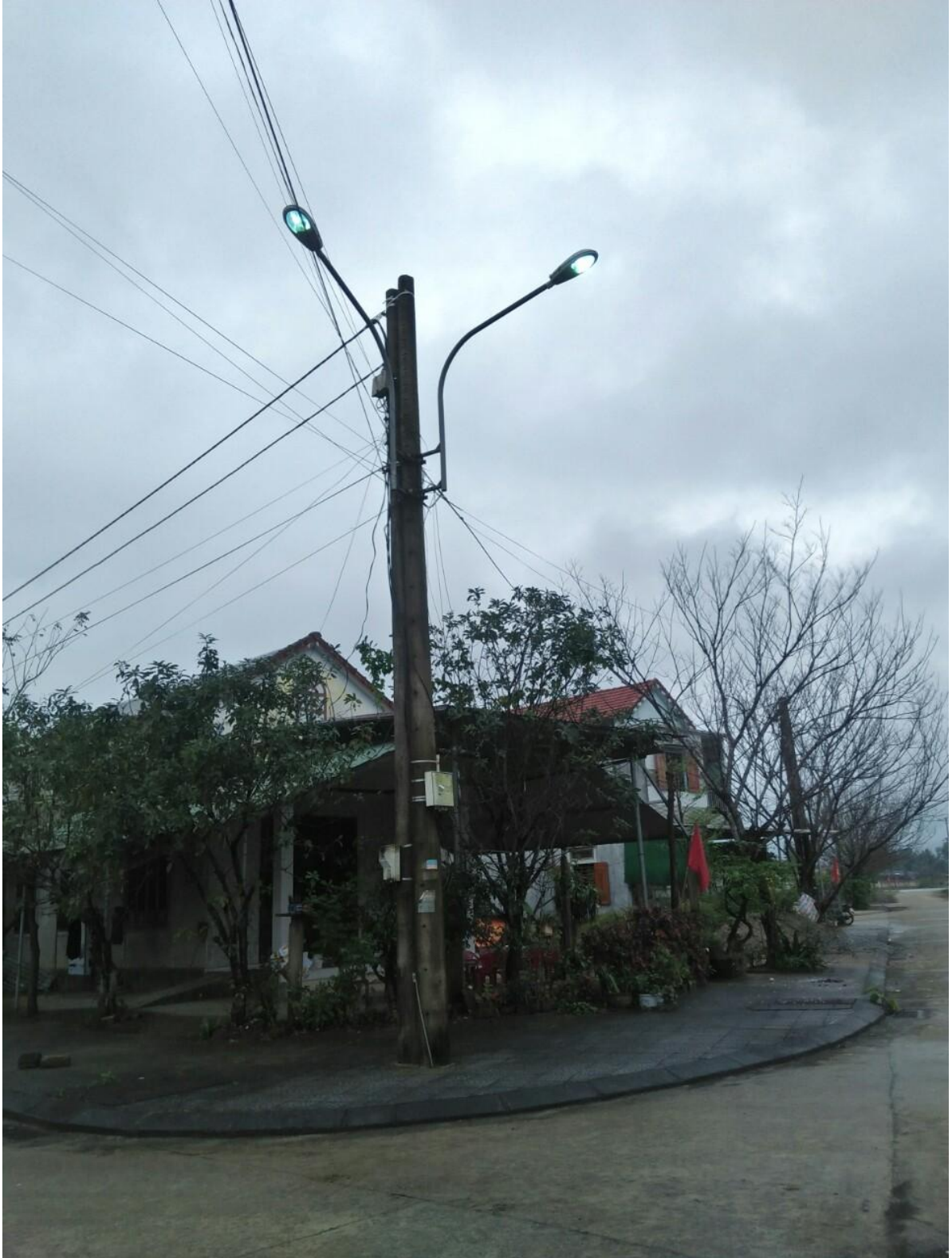
Ảnh 1: Trụ đèn hệ thống điện chiếu sáng ở Khu Tái định cư xã Lộc Trì ngày 09/02/2021

(Hình ảnh kèm theo Báo cáo số 21/BC-QLĐT ngày 09/02/2021 của Đội Quản lý đô thị)